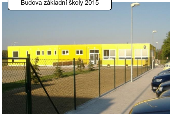
Budova základní školy 2015

lhned po dokončení první etapy výstavby základní školy, jejíž kapacita je 60 žáků, byla zahájena příprava projektu druhé etapy, jejímž cílem je vybudování plně organizované základní školy pro 1. až 9. ročník pro celkem 270 žáků. V současné době je již hotový projekt a vydané stavební povolení a je znám dodavatel stavby, který vzešel z otevřeného výběrového řízení. Vlastní stavba má být zahájena v červnu 2016 a dokončena v srpnu téhož roku. Škola je plánována jako spádová i pro dvě menší sousední obce Radějovice