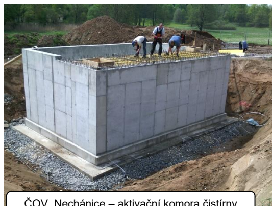
ČOV Nechánice – aktivační komora čistírny

Součástí výstavby kanalizace v Nechánicích je také dostavba poslední větve vodovodního řádu v ulici Nad Chvátalkou. Odkanalizování Nechánic bude dovršen rozvoj inženýrských sítí v celé obci Sulice. Ostatní obecní části jsou již odkanalizovány, s výjimkou dvou ulic na Želivci a jedné ulice na „staré“ Hlubočině. I pro tyto zbývající ulice se snažíme zajistit co nejdříve finanční krytí na výstavbu. Věříme, že finanční prostředky ve výši zhruba 6 milionů Kč se nám podaří co nejdříve získat a výstavbu zrealizovat ještě v roce 2016.