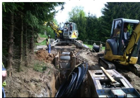
výstavba kanalizace a vodovodu Nechánice

Z výběrového řízení na dodavatele stavby vyšla jako vítězná společnost Mobiko plus s.r.o., která zahájila stavbu v první polovině měsíce dubna 2016. Předpokládaný termín dokončení stavby a uvedení do zkušebního provozu je listopad 2016. Celkové náklady na výstavbu díla jsou předpokládány v částce vyšší než 16 mil. Kč. Výstavba bude financována z investičního úvěru a rozpočtu obce. Vedení obce se snaží získat podporu z dotačních titulů EU, ale prozatím marně. Obci nezbývá, než technickou infrastrukturu financovat z vlastních prostředků.