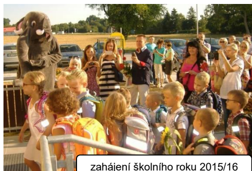
zahájení školního roku 2015/16

a Křížkový Újezdec. Druhý stupeň ZŠ budou navštěvovat také žáci z partnerské ZŠ v Kostelci u Křížků. Projekt druhé etapy dostavby modulární základní školy v celkové výši více jak 28 milionů Kč byl předběžně podpořen Ministerstvem financí ČR, a to ve výši bezmála 20 mil. Kč. Zbývající část této investice uhradí obec ze svého rozpočtu. Na vybavení nových prostor, učeben ZŠ, přislíbily finanční spoluúčast i obce, jejichž žáci ji navštěvují či do ní v budoucnu nastoupí.